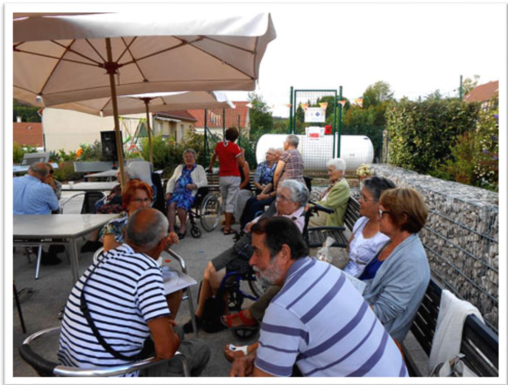
Un moment de convivialité