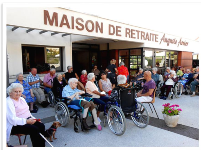
Les familles, les amis...

Le samedi 20 septembre a eu lieu notre traditionnelle tombola, les familles, les amis sont venus nombreux partager ce moment de convivialité avec les résidents.