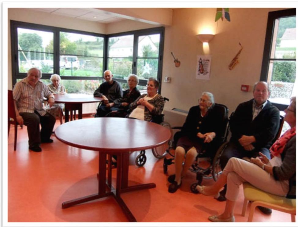
Vivement la dégustation du gâteau