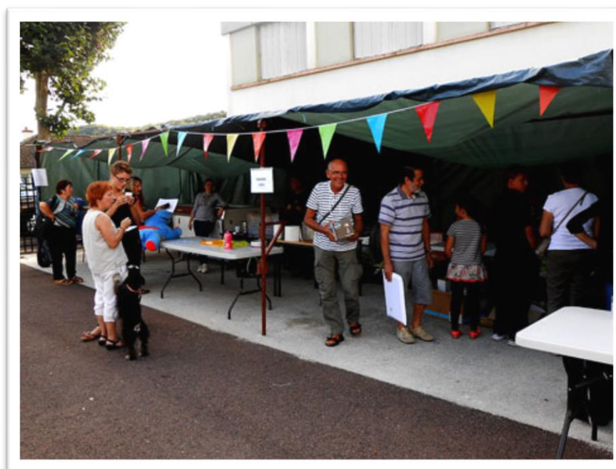
Des jeux, dégustation à la buvette, des gaufres...