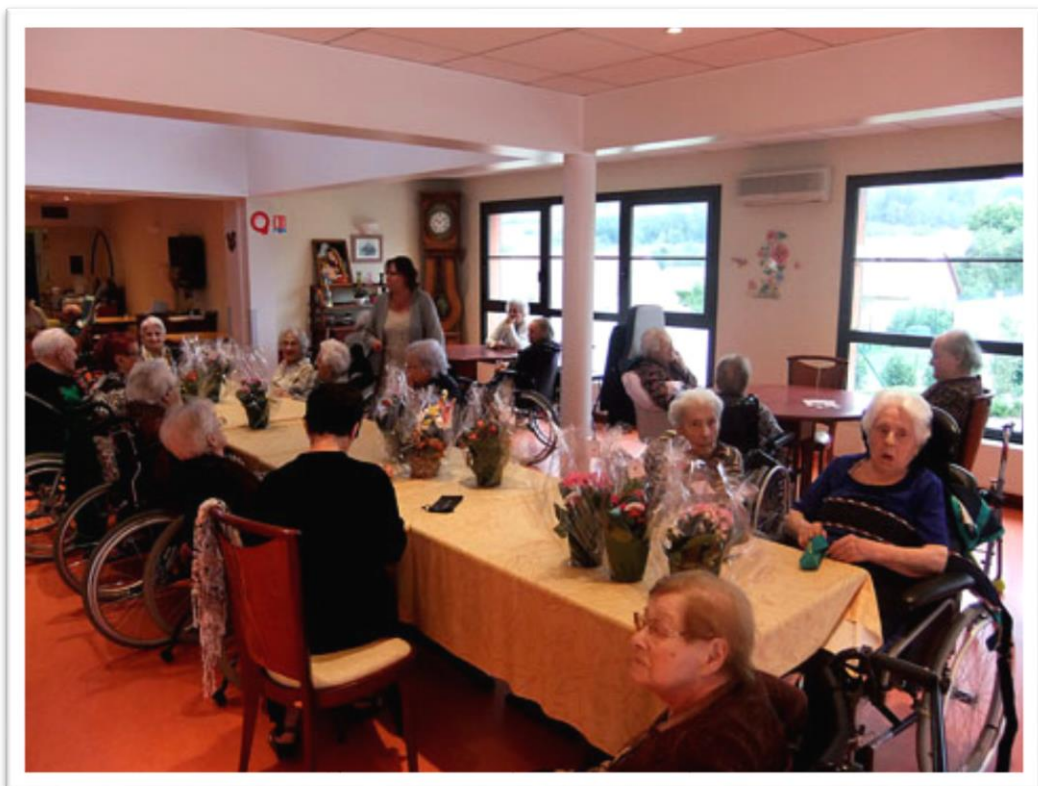
De nombreux anniversaires ce mois-ci !!