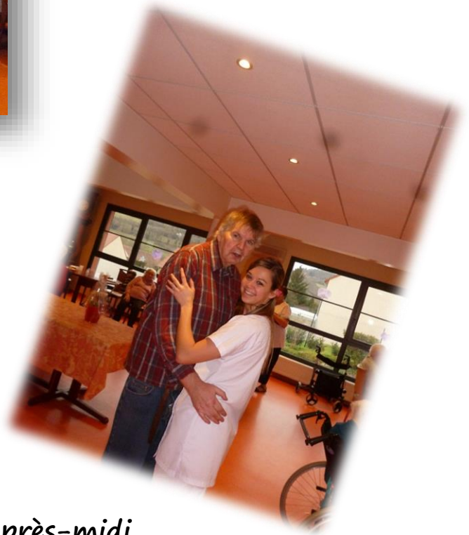
En cet après-midi joyeux les danses en duo étaient présentes