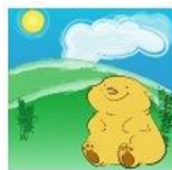
La marmotte au soleil

Soleil de la Chandeleur Annonce hiver et malheur