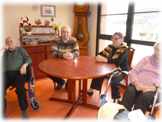
Les résidents attendent patiemment l'arrivée du gâteau