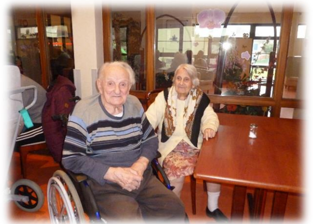
Que c'est bon de voir les personnes sourires