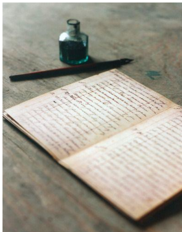
Écrire un poème

C'est moi Février, le mois le plus court de l'année. Habituellement, je n'ai que vingt-huit jours de labeur, Un travail que j'affronte sans peur. Je suis fringant et enjoué, on m'appelle le bébé du calendrier.