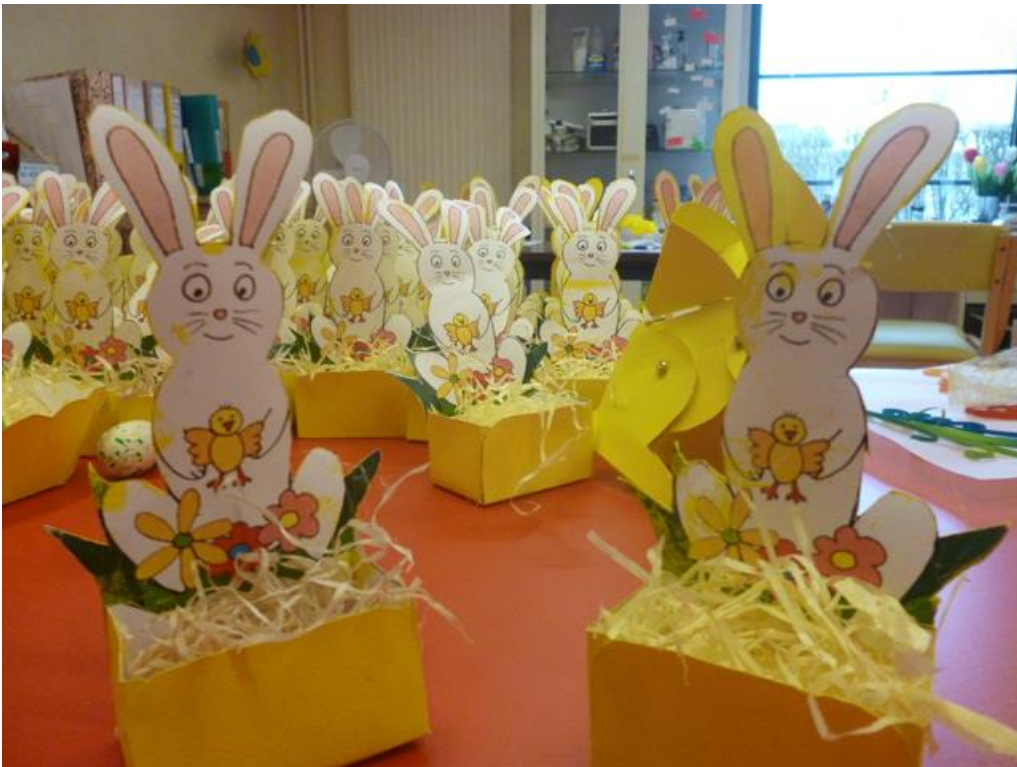
Sujets réalisés par les résident(e)s