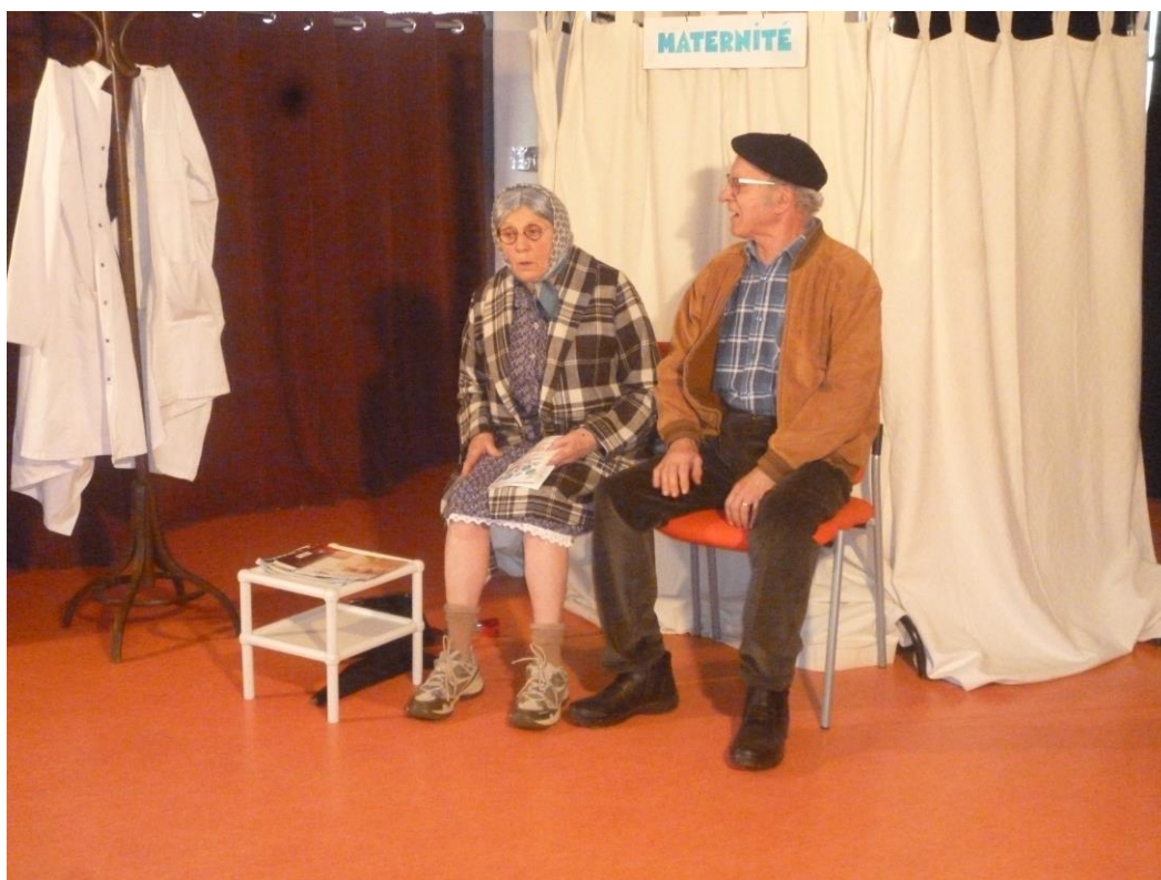
Scène de vie de la troupe Bourguiguis