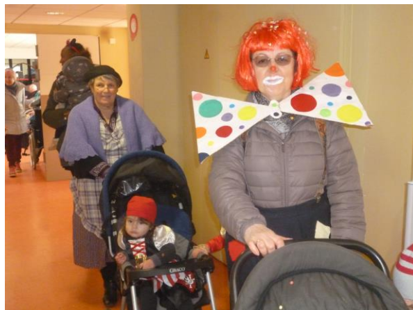
Les assistantes maternelles se sont jointes au cortège