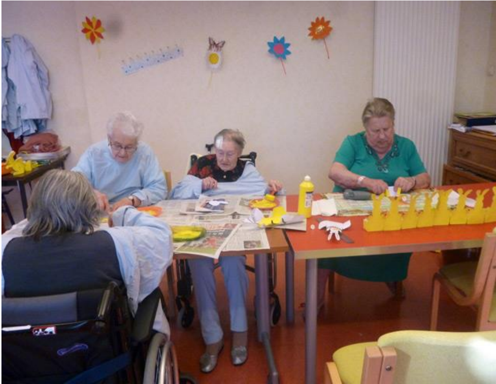
Collage, peinture, coloriage....