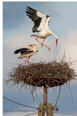
Nid de cigognes

Les prés reverdissent, on va cueillir les pissenlits. Pour qu'ils soient bien blancs, il faut creuser dans les taupinières.