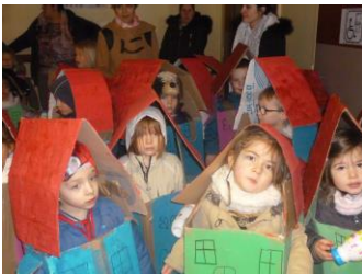
Les enfants de la maternelle

En région parisienne, on ne faisait pas des fantaisies. Quand je suis arrivée en Côte d'Or, j'ai découvert ces gâteaux. Ma belle-mère était forte pour faire ce genre de pâtisserie !