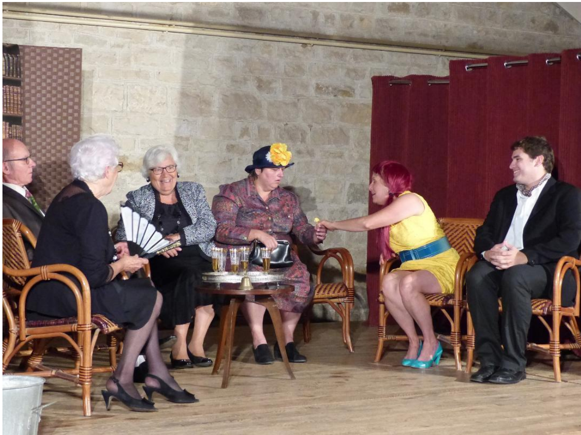
La troupe Bourguiguis en action !

Le samedi 3 mars 2018, nous avons eu le plaisir d'assister à la représentation de la troupe de théâtre locale, Les Bourguiguis , apportant fraîcheur et surtout une bonne humeur aux résident(e)s !