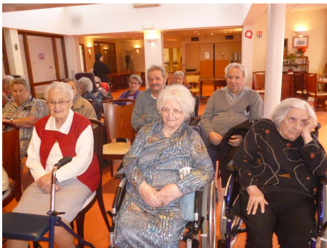
Ravisement et enthousiasme...

Des éclats de rires et applaudissements de la part des résident(e)s.