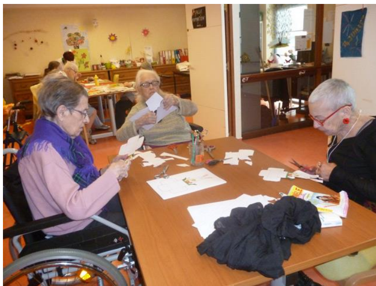
Les résidentes s'appliquent... découpage, pliage...

Pâques est une belle période pour se lancer dans de chouettes activités avec les résident(e)s. Nous avons fait une petite sélection de quelques bricolages réalisés. Chacun a trouvé sa place dans ces activités manuelles !