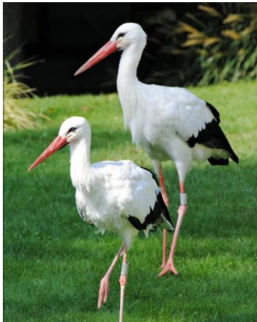
Arrivée des cigognes

Mais l'hiver n'est pas content. Il n'a pas dit son dernier mot. Il ne se passe pas un mois de mars sans giboulées de neige, grêle ou grésil. Il va pourtant falloir s'activer pour bêcher le jardin, remuer la terre pour la rafraîchir. Il faut rajeunir les haies, tailler les rosiers. Comme le dit le dicton : « taille tôt, taille tard mais taille en mars ».